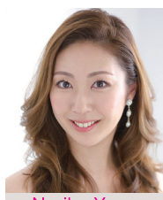
Noriko Yomo 四方典子 ソプラノ

早稲田大学第一文学部卒業。桐朋学園大学を経て、ウィーン国立音楽大学、イタリア・シエナのキジアーナ音楽院で学ぶ。1997年同音楽院より「フランコ・フェララ大賞」を授与され、1年間ジャンルイジ・ジェルメッティのアシスタントとしてロンドン・コヴェントガーデン、ミュンヘン・フィル等に行方し研鑽を積む。これまでに指揮を高階正光、カール・エステルライヒャ、ウロシュ・ラヨヴィッチ、湯浅勇治、カルロ・マリア・ジュリーニ、ヨルマ・パヌラ、ネーメ・ヤルヴィの各氏に師事。2000年ミトロプーロス国際指揮者コンクール優勝。以降、ヴェニスフェニーチェ歌劇管弦楽団、サンクト・ペテルブルグ・フィルハーモニー交響楽団、オランダ放送管弦楽団、ウィーン室内管弦楽団、イギリス室内管弦楽団を始め、イタリアを中心にヨーロッパ各国のオーケストラへ客演。日本では2001年に大阪交響楽団を指揮してデビュー。これまでに札幌交響楽団、仙台フィルハーモニー管弦楽団、新日本フィルハーモニー交響楽団、東京シティ・フィルハーモニック管弦楽団、日本フィルハーモニー交響楽団、名古屋フィルハーモニー交響楽団、セントラル愛知交響楽団、関西フィルハーモニー管弦楽団、九州交響楽団等を指揮している。2004年1月大阪交響楽団正指揮者に就任。2011年4月からは常任指揮者として足掛け15年間、ウィーン世紀末のロマン派音楽を積極的にとりあげ続け、とりわけ2013年6月の第176回定期演奏会における「オールハンス・ロット プログラム」は大きな反響を呼び、同年の大阪文化祭賞を受賞した。1991年よりウィーン在住30年。