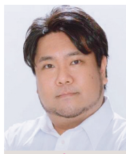
Kiyohito Shimakage 島影聖人 テノール

2017年、オペラの殿堂・ウィーン国立歌劇場にライマン「メデア」ヘロルド役で鮮烈にデビュー。東洋人のカウンターテナーとして初めての快挙で、大きなニュースとなる。2012年、第31回国際ハンス・ガボア・ベルヴェデーレ声楽コンクールにてハンス・ガボア賞を受賞。同年、日本音楽コンクール第1位。2013年、ボローニャ歌劇場にてグルック「クレーリアの勝利」マンニオ役でヨーロッパデビュー。国内では、主要オーケストラとの公演や各地でのリサイタルがいずれも絶賛を博している。新国立劇場2020/21シーズン開幕公演では、プリテン「夏の夜の夢」にオーベロン役で主演、続けてバハ・コレギウム・ジャパンとのヘンデル「リナルド」でもタイトルロールを務め、その圧倒的な存在感と唯一無二の美声で聴衆を魅了し、オペラ歌手としての人気を不動のものにする。2021年には3枚目のアルバム「いのちのうた」がキングインターナショナルよりリリースされた。2023年は<全国共同制作オペラ> J.シュトラウスII世「こもり」オルロフスキー役をはじめ各地でオペラ公演や演奏会への出演が予定されている。デビューから現在まで話題の中心に存在する、日本が世界に誇る国際的なアーティストのひとりである。洗足学園音楽大学客員教授。横浜みなとみらいホール プロデューサー 2021-2023。Official Website: www.daichifujiki.com